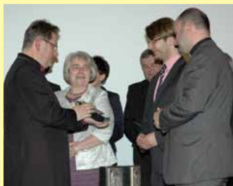
...Ewangelickie Towarzystwo Edukacyjne, Fundacja Edukacyjna im. S. Bandtkiego oraz Ewangelickie Centrum Diakonii i Edukacji im. ks. M. Lutra