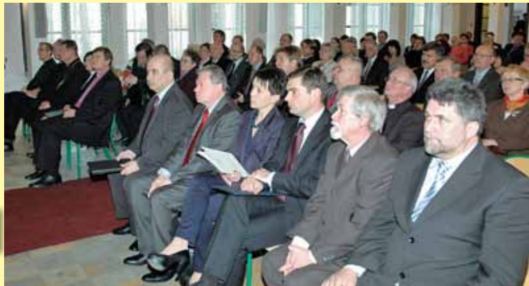
Przedstawiciele władz samorządowych i parlamentu