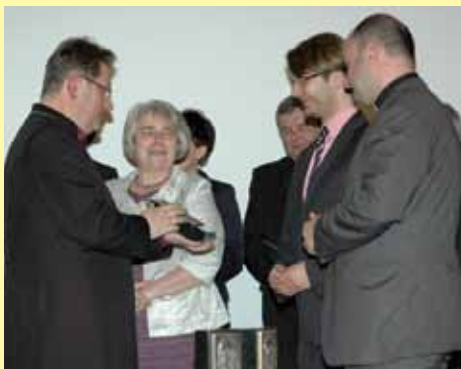
...Ewangelickie Towarzystwo Edukacyjne, Fundacja Edukacyjna im. S. Bandtkiego oraz Ewangelickie Centrum Diakonii i Edukacji im. ks. M. Lutra