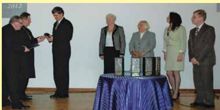
Nagrodę im. ks. L. Otto otrzymali: Towarzystwo Szkolne im. M. Reja, Towarzystwo Ewangelickie im. F. Michejdy,...