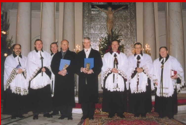
Laureaci w otoczeniu duchownych