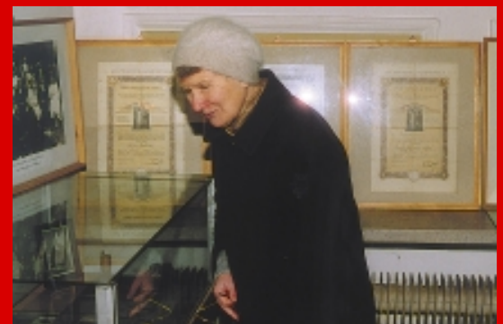
Okolicznościowa wystawa przygotowana przez warszawską parafię i stoisko książek Wydawnictwa „Augustana” cieszyły się zainteresowaniem