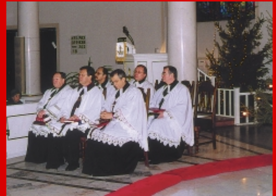
W liturgii czynnie uczestniczyli duchowni z różnych diecezji