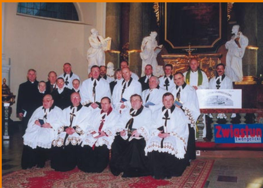
Duchowni i siostry diakonise uczestniczący w dziękczynnym nabożeństwie