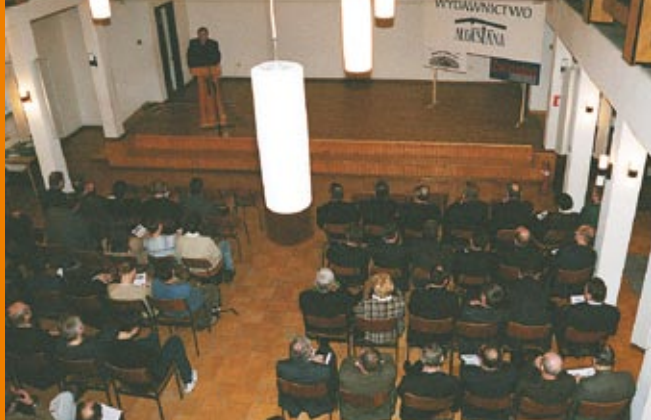
Sesja historyczna w Bielsku-Białej 15 stycznia br.