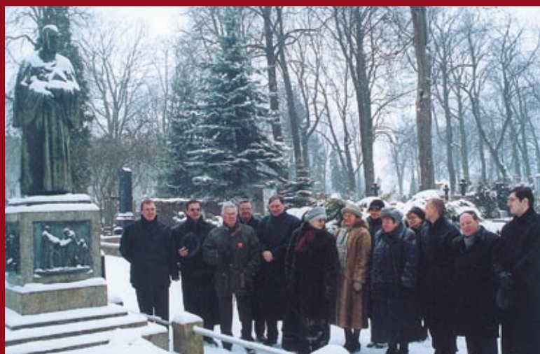
Na cmentarzu przed grobem ks. L. Otto