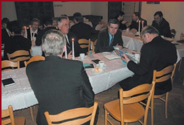
Spotkanie byłych i obecnych pracowników wydawnictwa z władzami Kościoła w Warszawie 11 stycznia br.