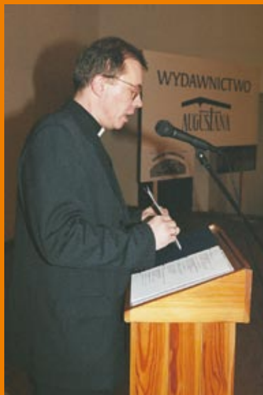
Prezentacja reprintu pierwszego numeru Zwiastuna