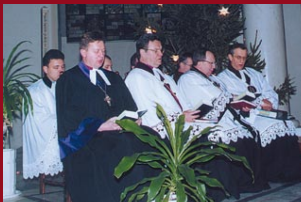
Duchowni uczestniczący w dziękczynnym nabożeństwie w warszawskim kościele Świętej Trójcy 12 stycznia br.