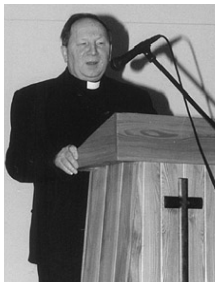
a życzenia przekazali: ks. J. Gross...