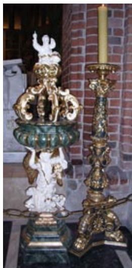
Chrzcielnica i ambona zdobi obecnie rzymskokatolicką katedrę w Poznaniu