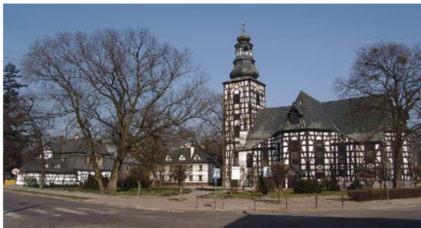
Pierwotny i współczesny wygląd kościoła