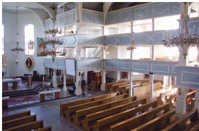
Wnętrze przed wojną i współcześnie